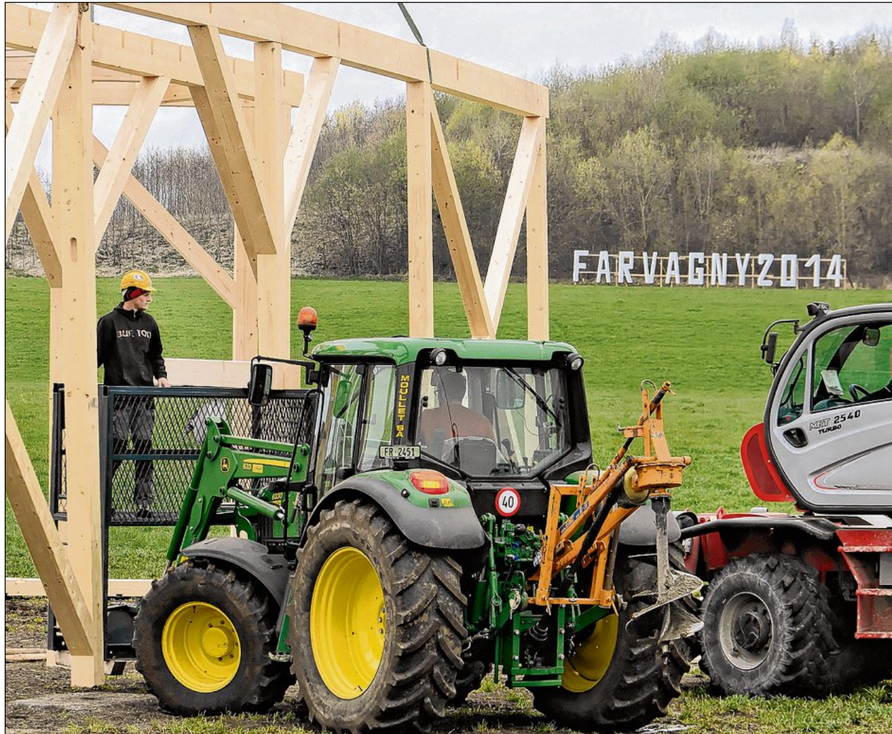
Depuis le mois de février, membres du comité de la manifestation et bénévoles s'activent sur le chantier du giron. Le village devrait être achevé au début du mois de juillet.

FARVAGNY • Destiné à accueillir le premier Giron cantonal des jeunesses fribourgeoises, un «village» se bâtit près de l'autoroute A12. Plus de 80 000 visiteurs sont attendus en 16 jours.